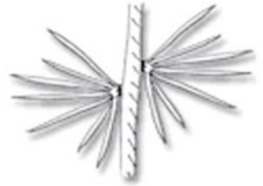
in Gruppen/Büscheln bei Nadelgehölzen