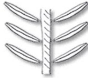
einzel am Zweig